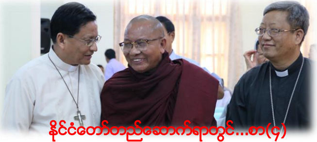
နိုင်ငံတော်တည်ဆောက်ရာတွင်...စာ(၄)