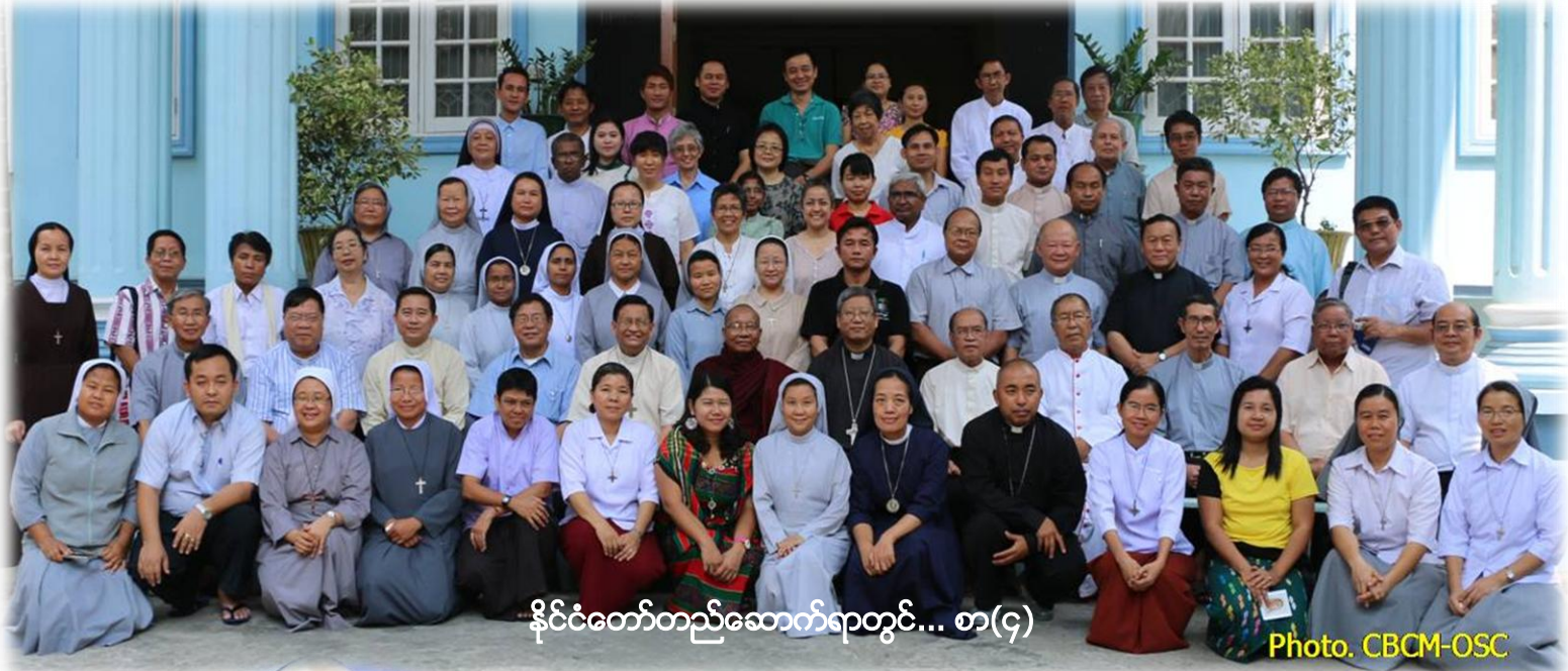
နိုင်ငံတော်တည်ဆောက်ရာတွင်... စာ(၄)

သမ္မတဦးထင်ကျော်၊ ဒု သမ္မတများဖြစ်ကြသောဦးမြင့်ဆွေ နှင့် ဦးဟင်နရီဗန်ထီးယူ တို့အား မြန်မာနိုင်ငံ ကက်သလစ်ဆရာတော်ကြီးများအဖွဲ့ချုပ်မှ ဝမ်းမြောက်ဂုဏ်ယူစွာဖြင့်ကြိုဆိုပါသည်။