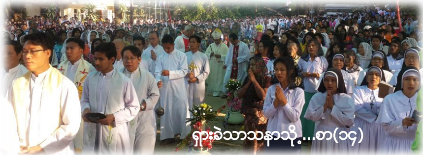
ရှားခါသာသနာသို့...စာ(၁၄)