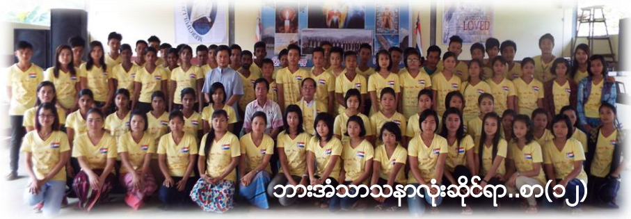
ဘားအံသာသနာလုံးဆိုင်ရာ..စာ(၁၂)