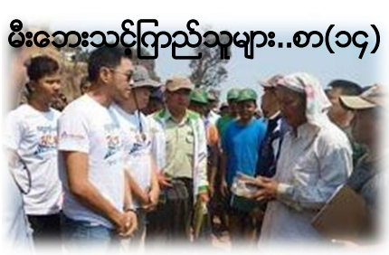
မီးဘေးသင့်ပြည်သူများ..စာ(၁၄)