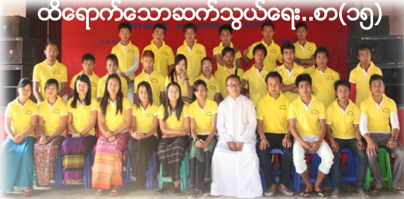
ထိရောက်သောဆက်သွယ်ရေး..စာ(၁၅)

ကမာဠအရပ်ရပ်သို့ သွားကြ၍ဇေယျဝိသုဒ္ဓိတရားတော်ကိုဟောပြောကြလော။