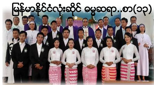
မြန်မာနိုင်ငံလုံးဆိုင် ဓမ္မဆရာ..စာ(၁၃)