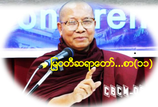
မြဝတီဆရာတော်...စာ(၁၁)